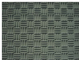
Perfilado T8 40/20

Pode ser aplicado pelo método de perfil à vista.